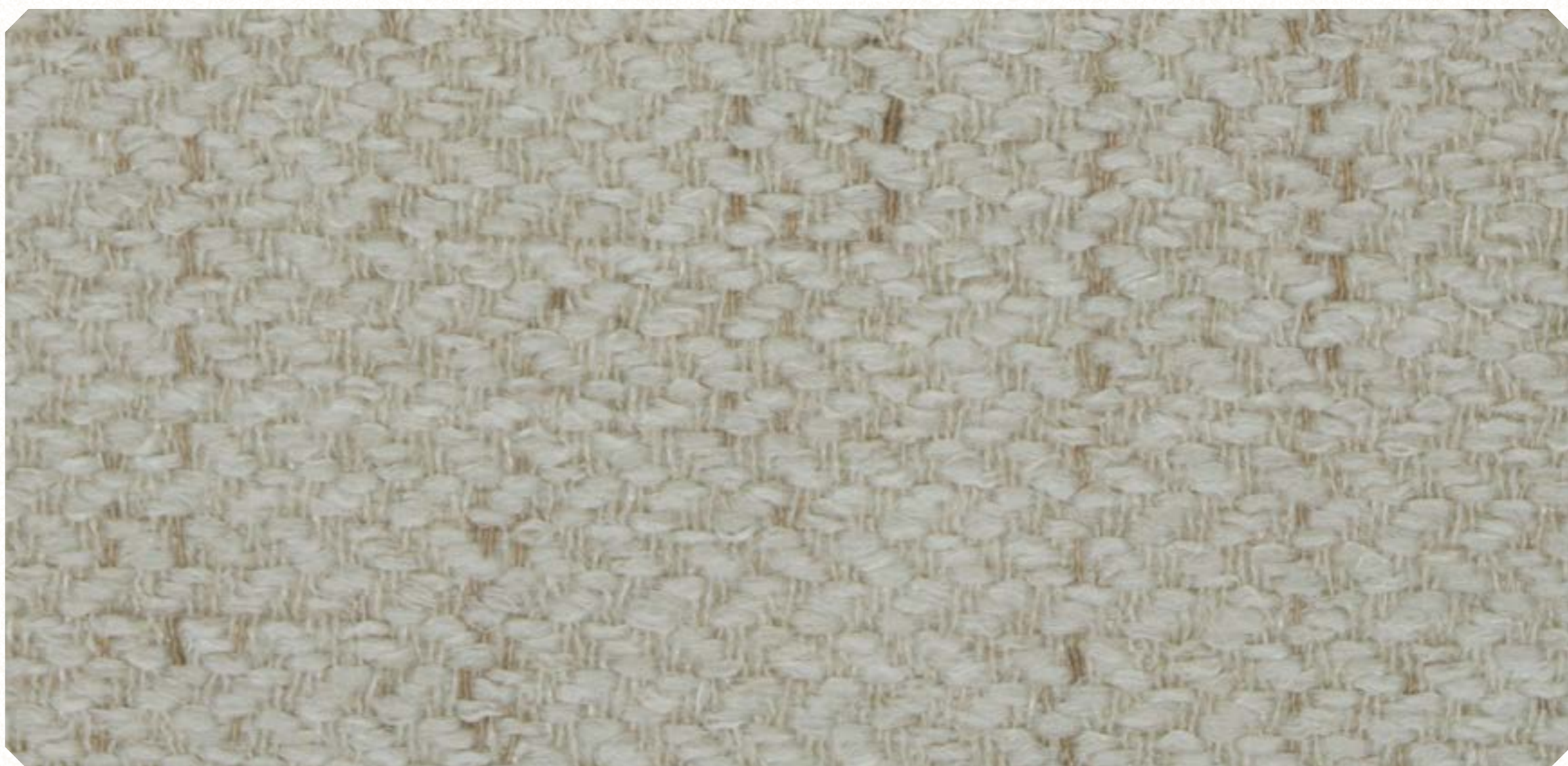
Linho Sky 02