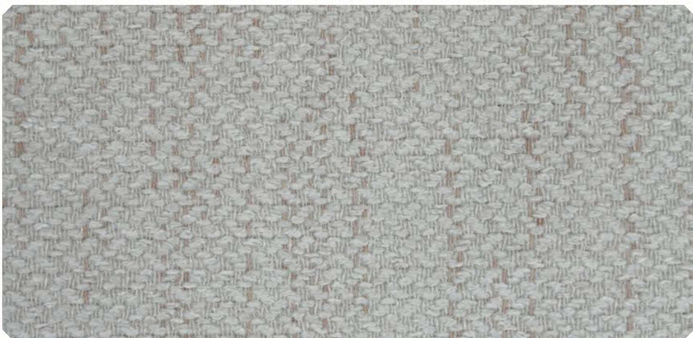
Linho Sky 01