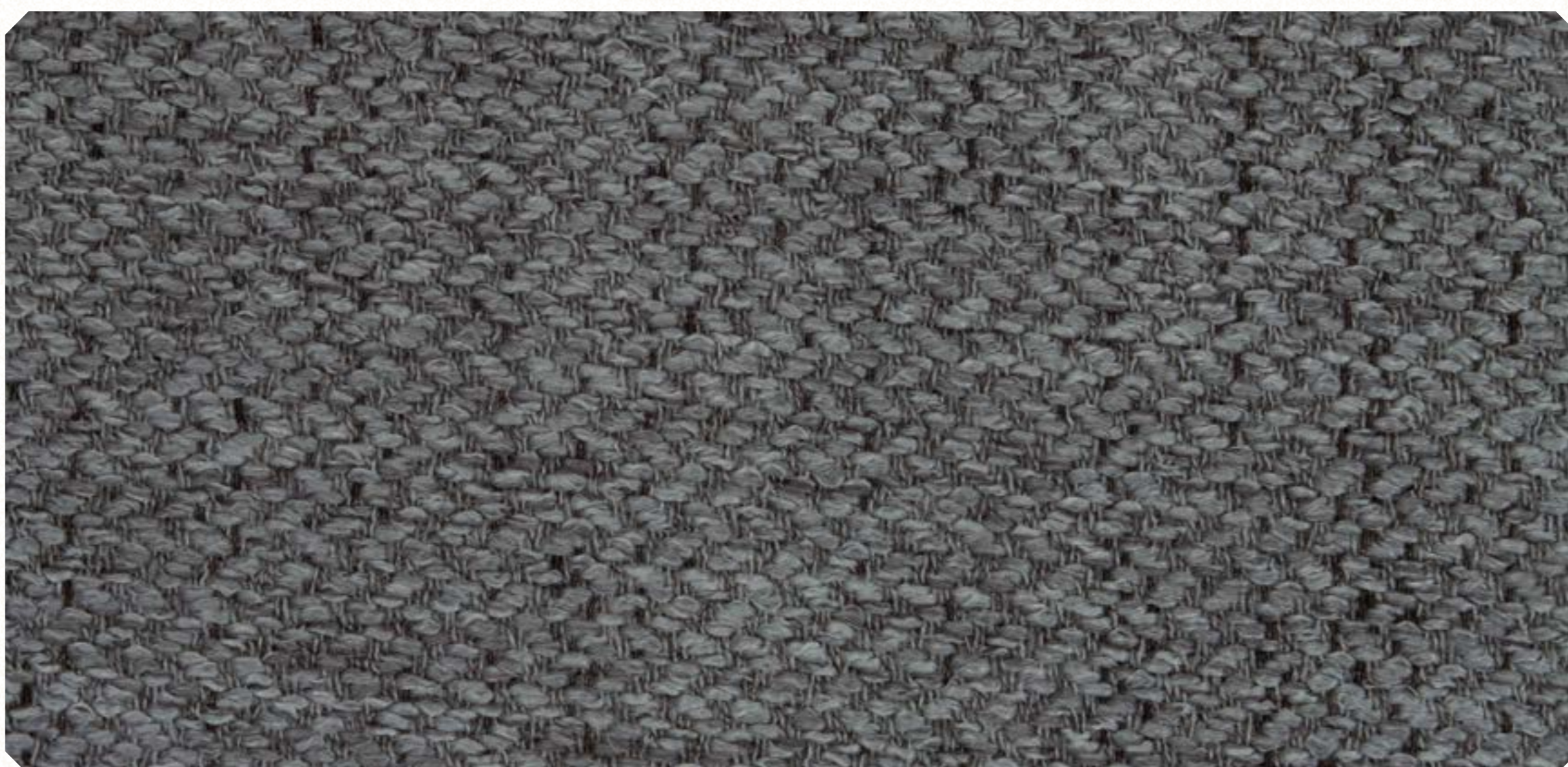
Linho Sky 04