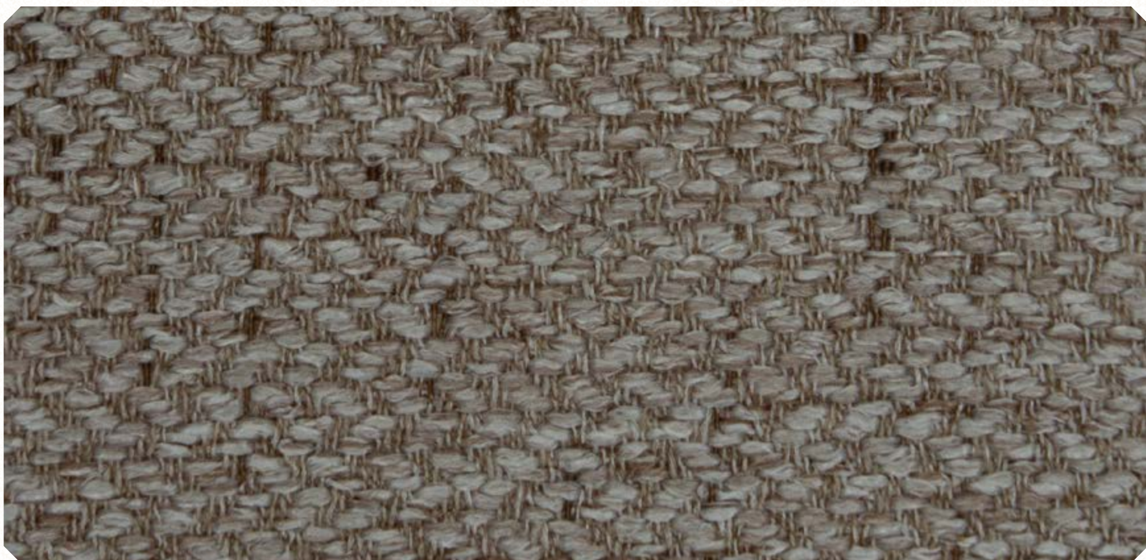
Linho Sky 03