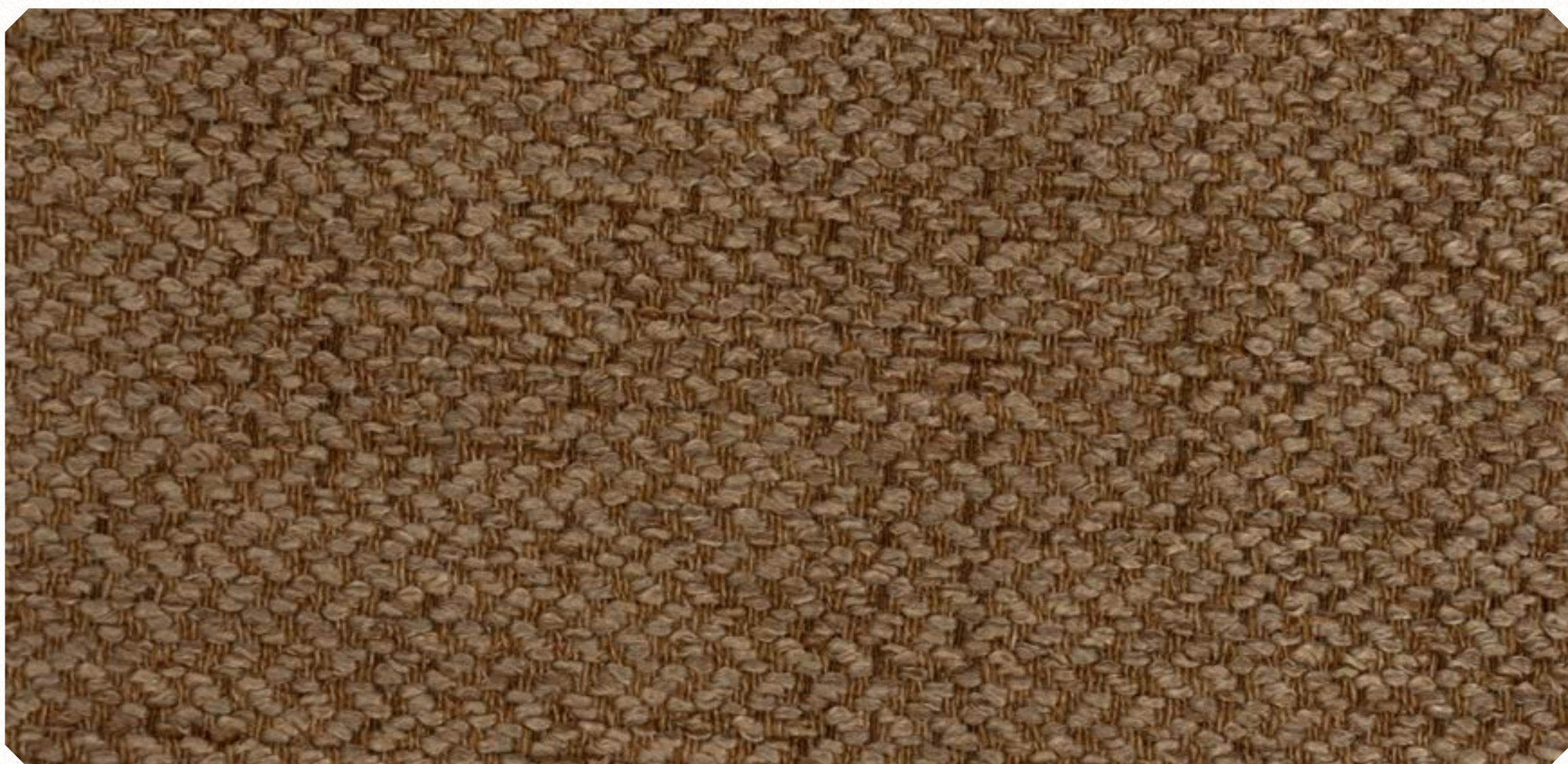
Linho Sky 07