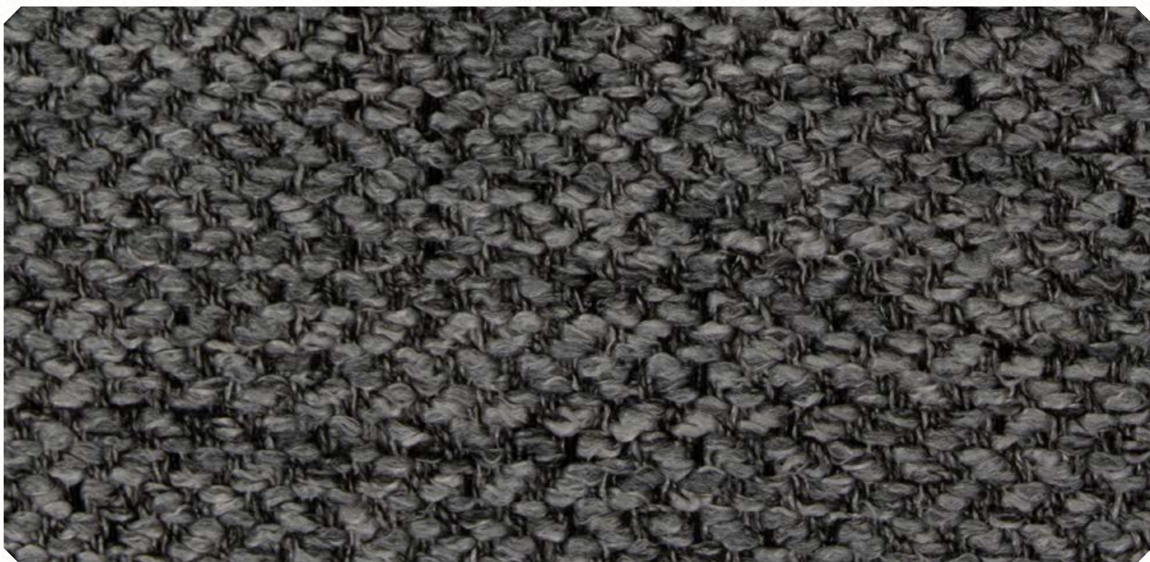
Linho Sky 05