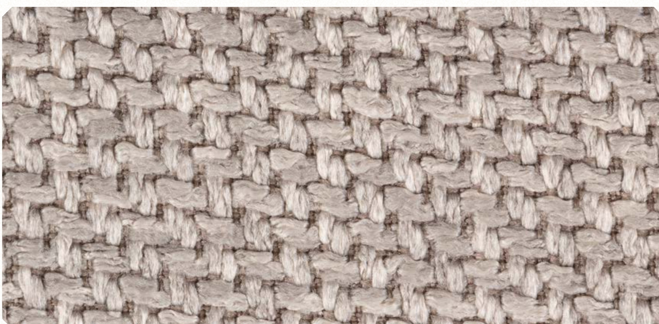
Linho Roma 03