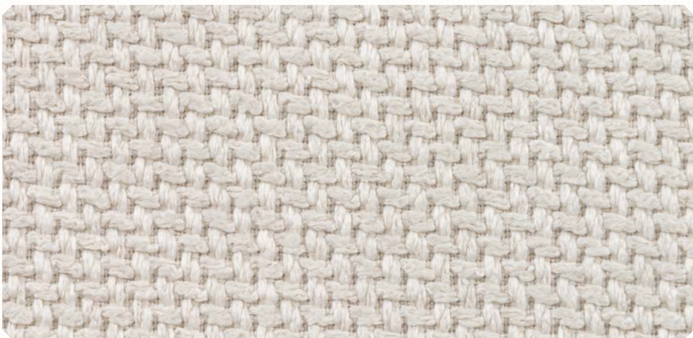
Linho Roma 01