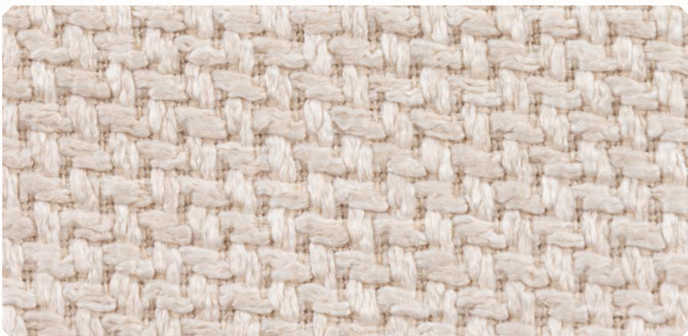
Linho Roma 02