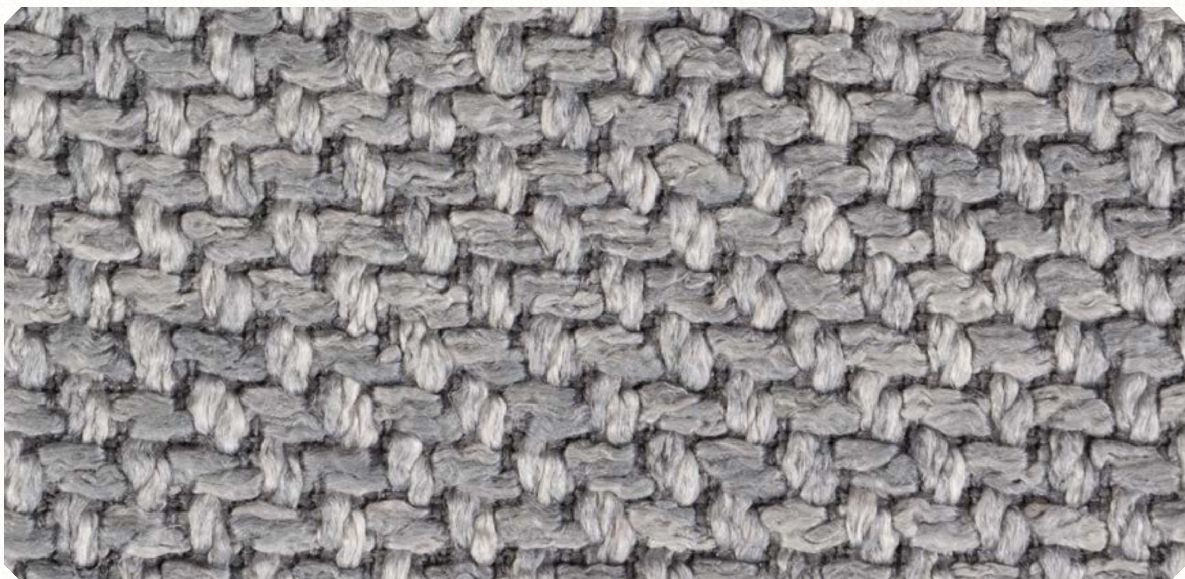
Linho Roma 08