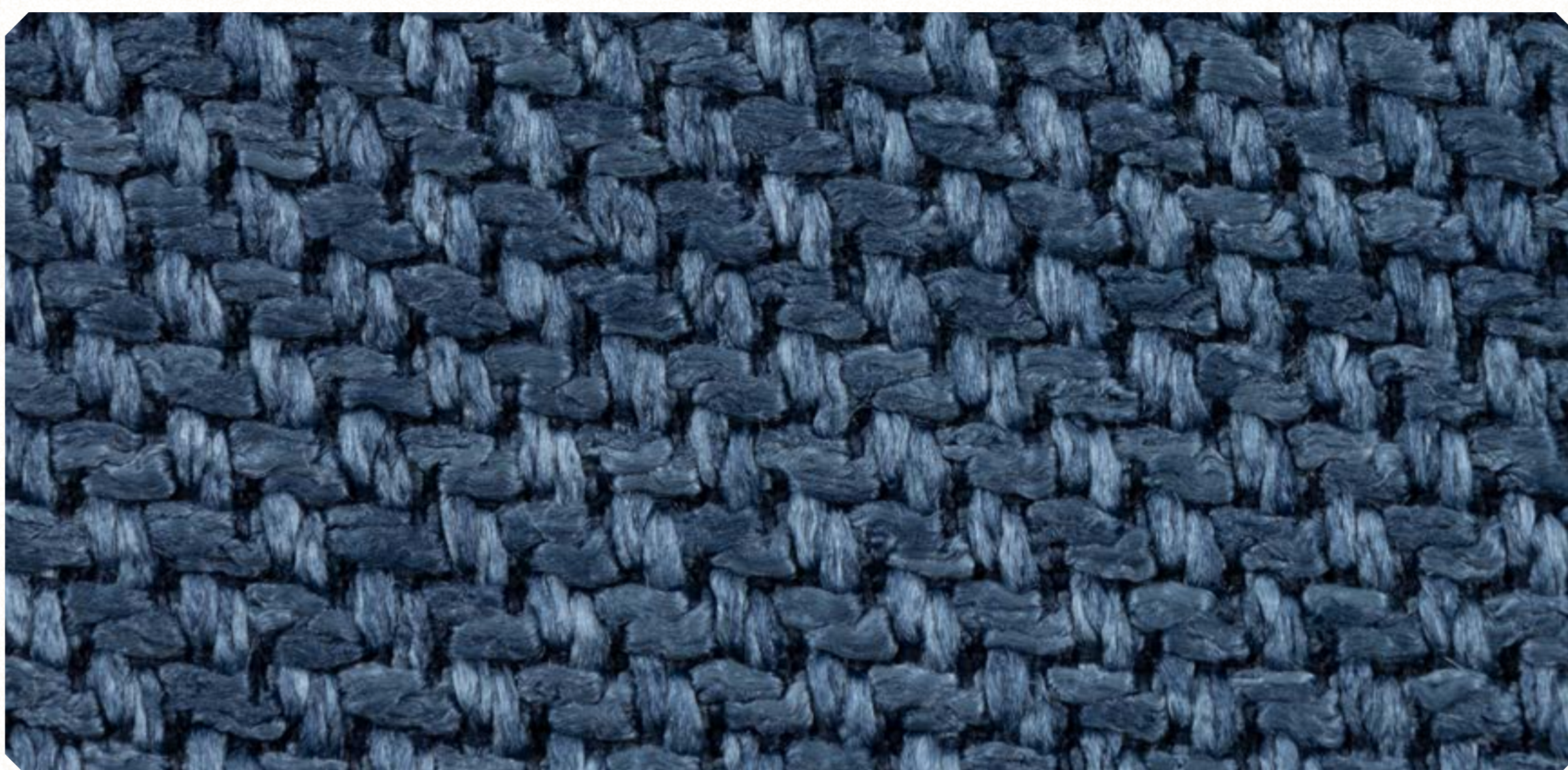
Linho Roma 06