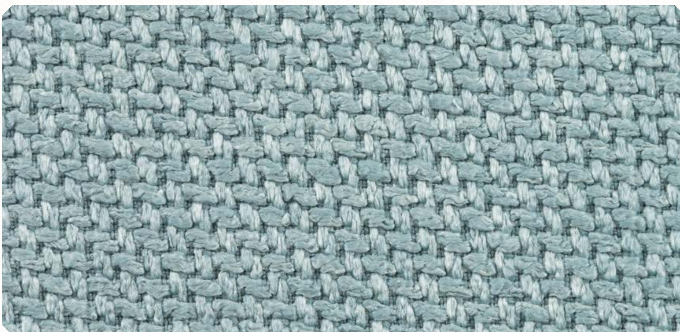
Linho Roma 04