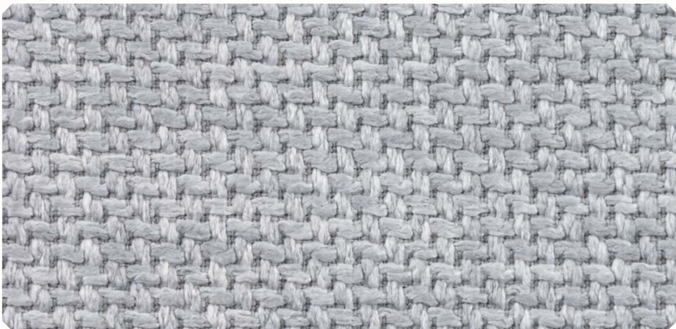
Linho Roma 07