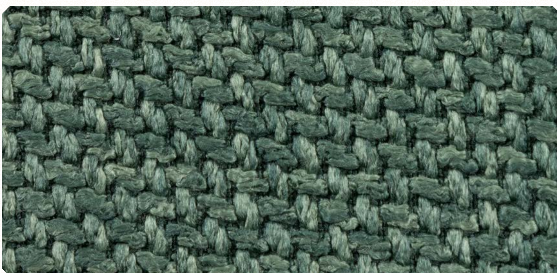
Linho Roma 05